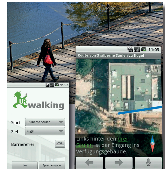
Erster Prototyp der UR-Walking-App für Smartphones

Für ein Tourenplanungssystem bedeutet dies z.B. die Möglichkeit, neben der normalen Tourgestaltung die Berücksichtigung von externen Faktoren wie Nahverkehrsanbindung, Wetterbedingungen, Öffnungszeiten, nutzerseitige Präferenzänderungen, u.ä. Die gleichen Prinzipien sind auf andere Recommender Systeme wie die Gesundheitsvorsorge oder Navigationssysteme anwendbar.