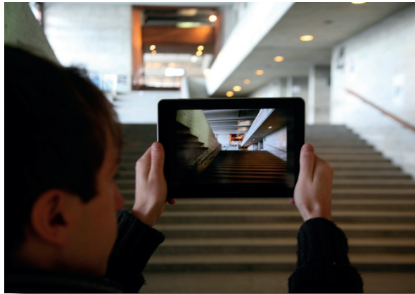
Optional bietet die APP dem Nutzer Bilder zur besseren Orientierung. Dies kann vor allem innerhalb der Gebäude sinnvoll sein.

Ein Spracherkennungs- und Ausgabesystem ermöglichen dem Nutzer die App komplett ohne lästiges Tippen zu bedienen.