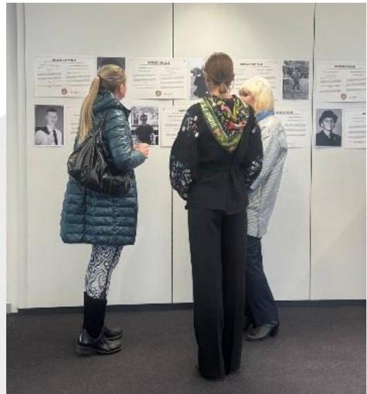
Gäste der Ausstellung an der UfU in München, 08.05.2024